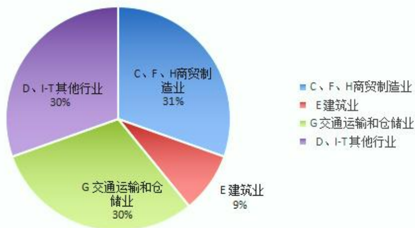
1-8月各类事故死亡人数分布图

5. 其他行业发生生产安全事故 2 起，死亡 7 人，同比事故起数增加 1 起，死亡人数增加 1 人。发生较大事故 1 起，死亡 6 人。